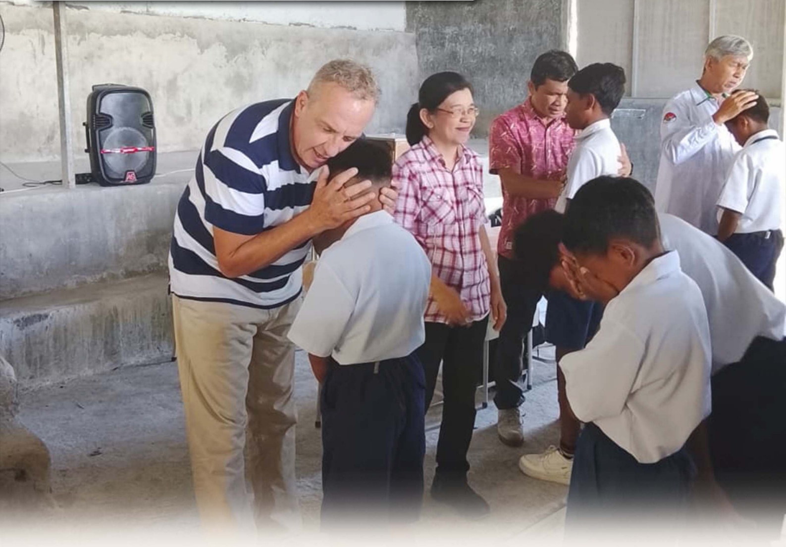
Kunjungan Pelayanan dari GSJA Siloam-Kayu Putih, beserta team dari Australia