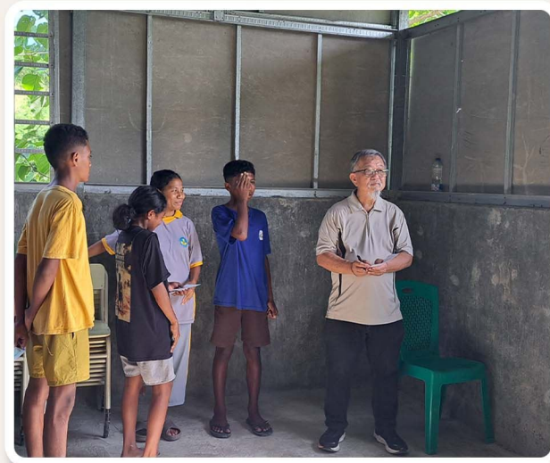
pemeriksaan mata (tes buta warna dan snellen chart)