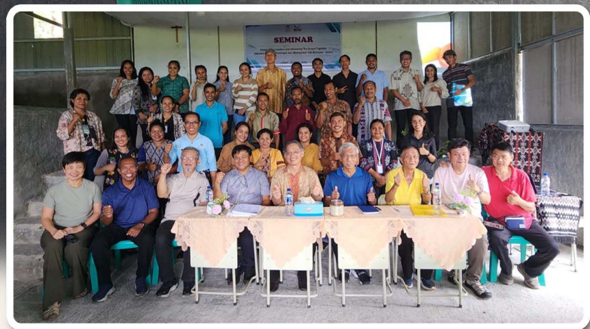
Seminar Leadership beserta kegiatan general health screening dari Team I.L.I (International Leadership Institute), Singapura