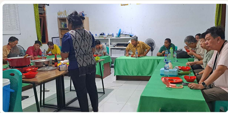
makan malam bersama