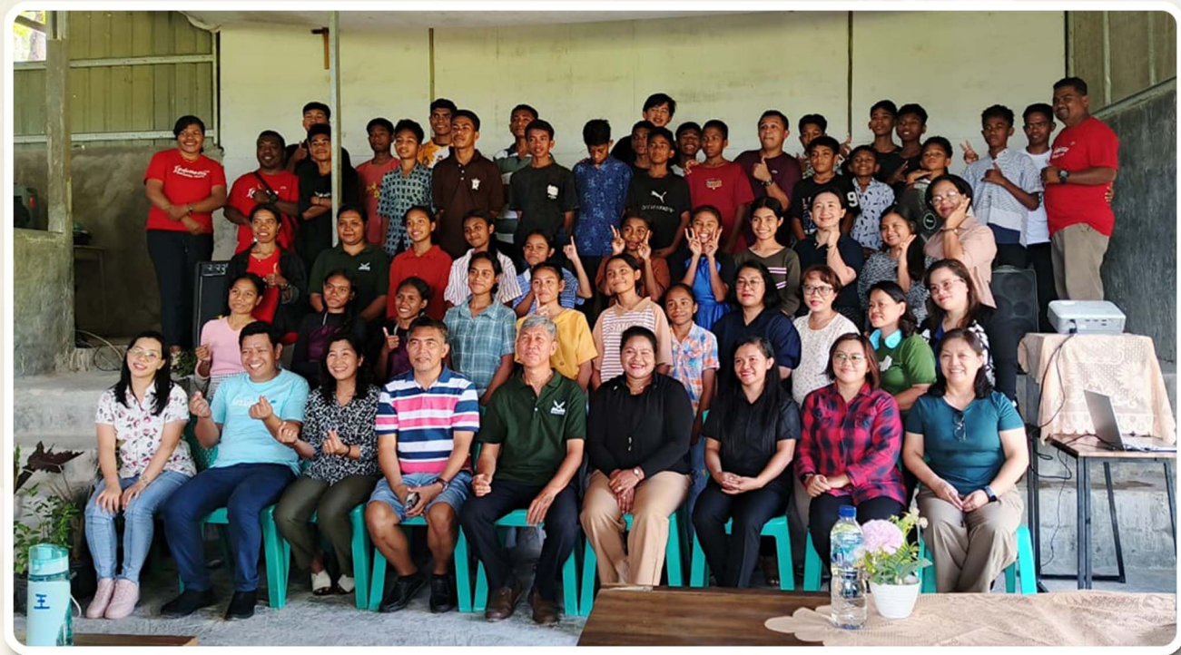
Kunjungan tim IPSCM (Indonesian Pastors Spiritual Care Movements), Filipina dan Indonesia